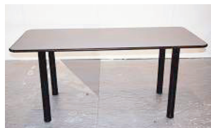
Tavolo rettangolare piano grigio dim. 150x70x72 h