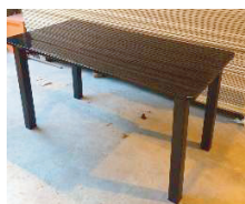
Tavolo rettangolare piano laccato nero dim. 140x70x72 h