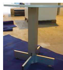
Tavolo tondo bianco dim. 60 cm x 70 cm h