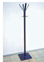
Appendiabiti a stelo nero