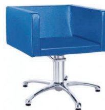
Poltroncina salotto colore blu