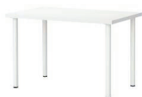
Tavolo rettangolare piano bianco dim. 120x70x72 h