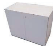
Armadietto con ante apribili e chiave dim. 80x40x70 h