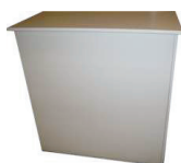
Desk reception dim. 50x100x102 h